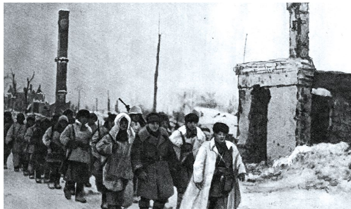
Вступление советских войск в Шлиссельбург. Январь 1943 г.