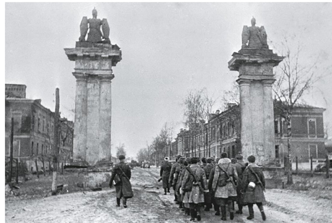
Советские войска входят в Гатчину через Ингербургские ворота. Конец января 1944 г.

Воспоминания бывшего командира 129-го гвардейского стрелкового полка. Бои за деревни Ханнолово, Туйпо, Род, Лампуля (не сущ., ныне тер. Ломоносовского р-на).