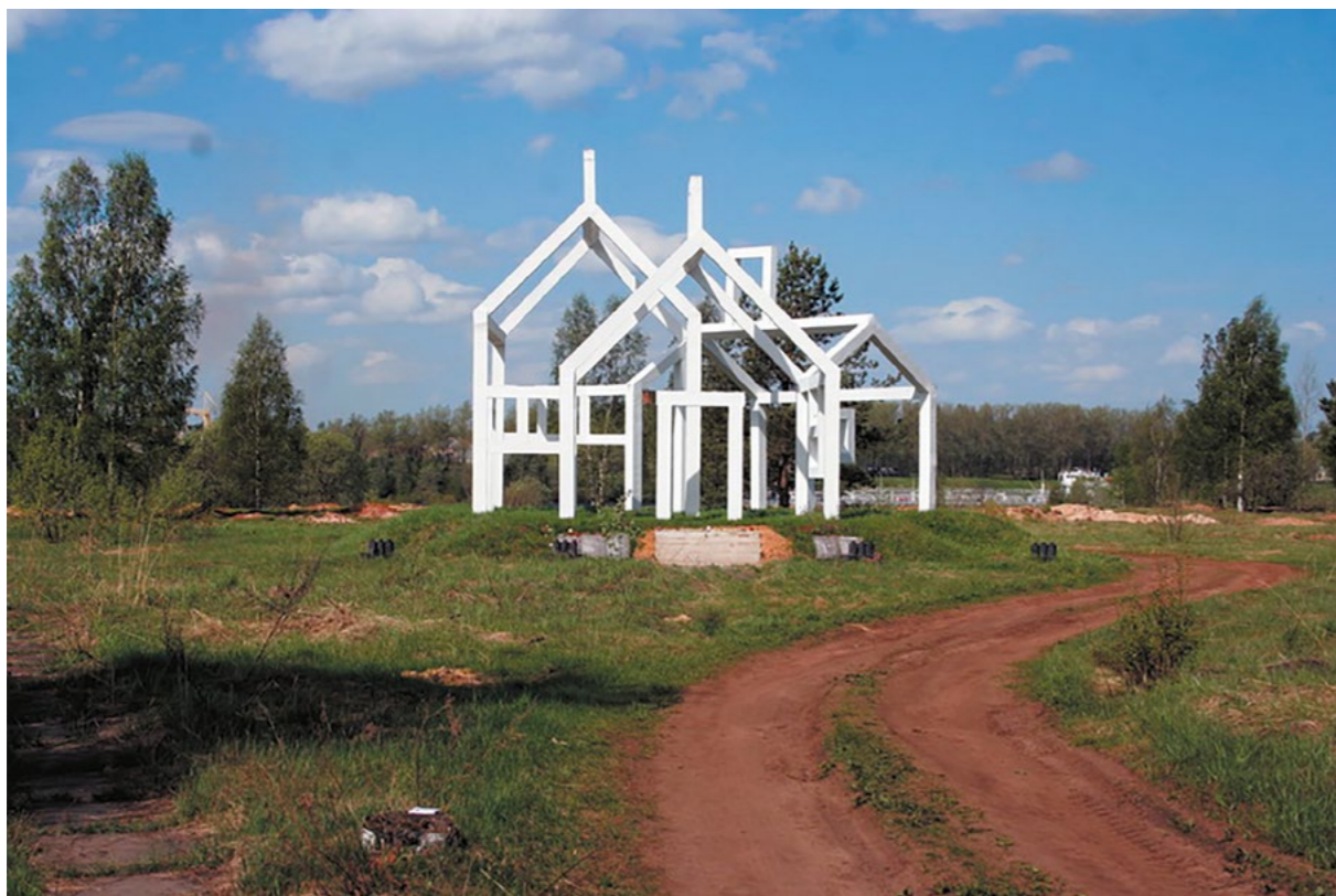
«Призрачная деревня» – памятник населенным пунктам земли Кировского района, уничтоженным во время Великой Отечественной войны (расположен на территории бывшей дер. Арбузово; Кировский р-н)