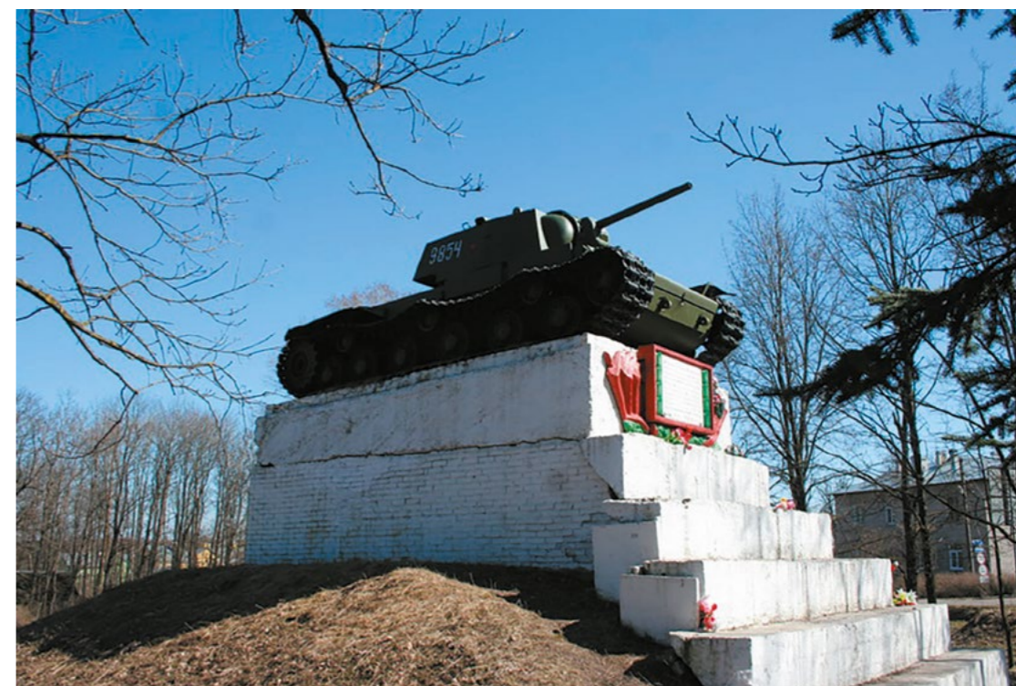
Памятник советским танкистам, отличившимся в боях за г. Ленинград в 1944 году