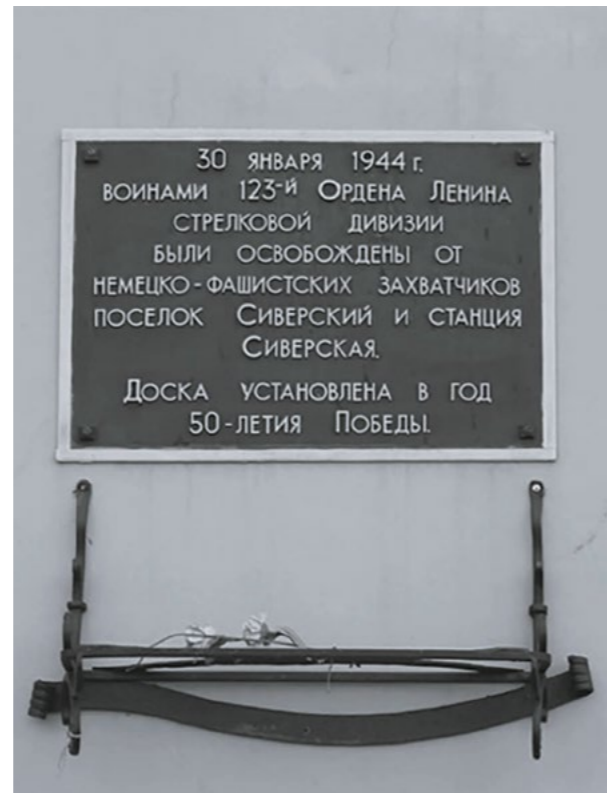
Мемориальная доска на вокзале ст. Сиверская