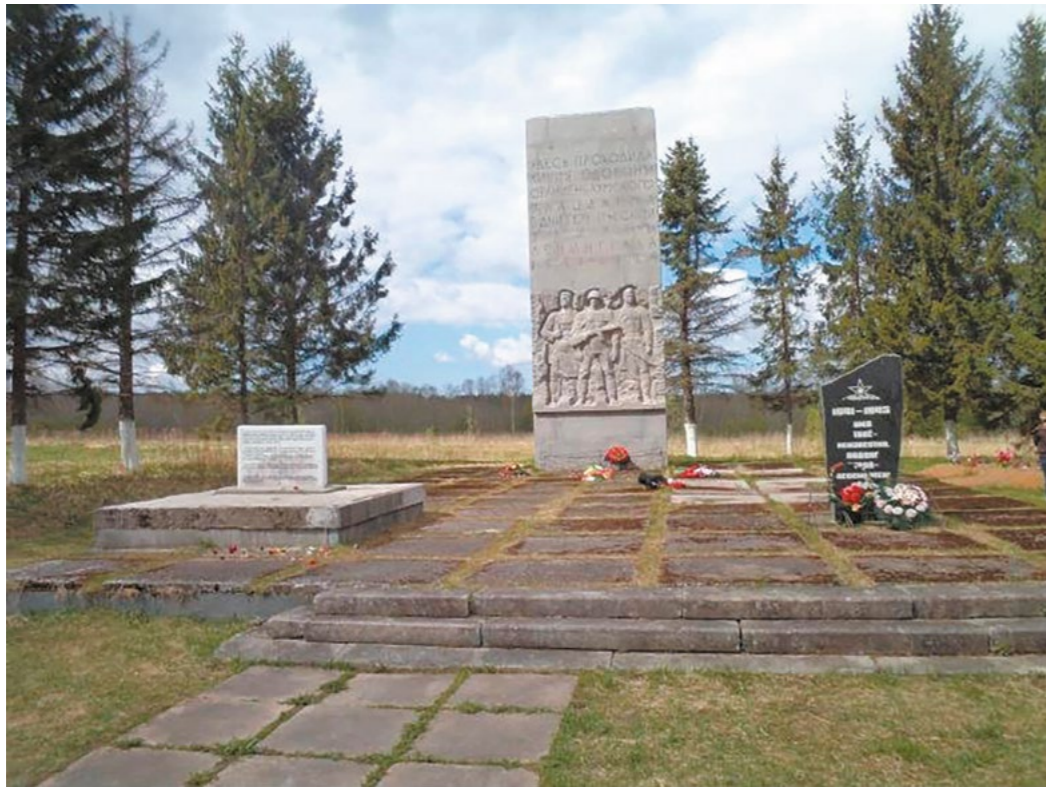
"Январский гром". Мемориал в память обороны Ленинграда в 1941-1944 гг. 19-й километр Гостилицкого шоссе