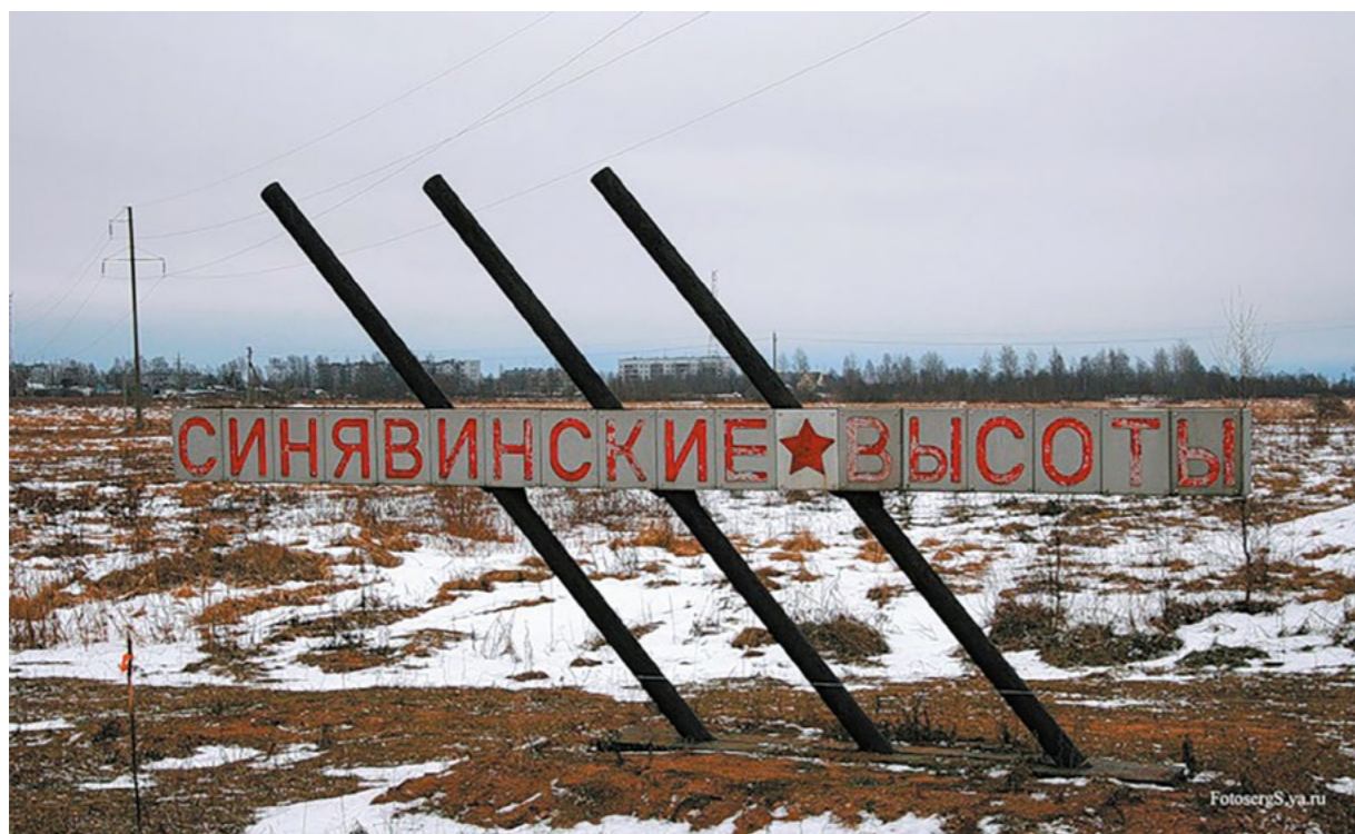
Памятный знак «Синявинские высоты» (расположен вблизи пос. Молодцово, Кировский р-н)

Ленинграда ; оформл. худ. И. А. Сафонов ; ред. Ю. К. Хрящев. – Санкт-Петербург : Ланс, 1994. – 352 с. : фото ил.