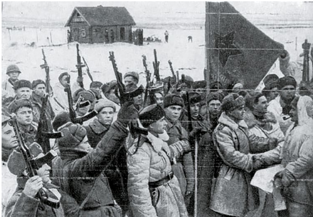
Встреча воинов 2-й ударной и 42-й армий в районе Ропши. 20 января 1944 г.

Действия Ленинградского фронта в рамках Ленинградско-Новгородской стратегической наступательной операции (14 января – 1 марта 1944).