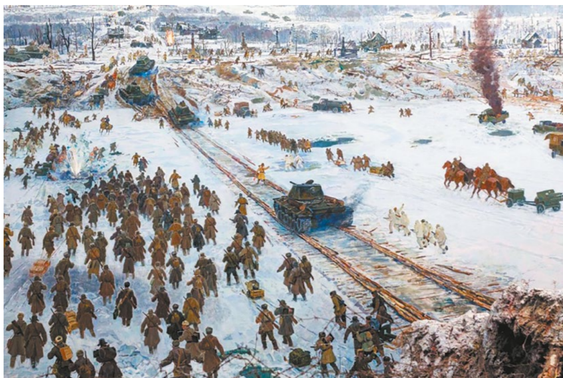
Фрагмент диорамы «Прорыв блокады Ленинграда»