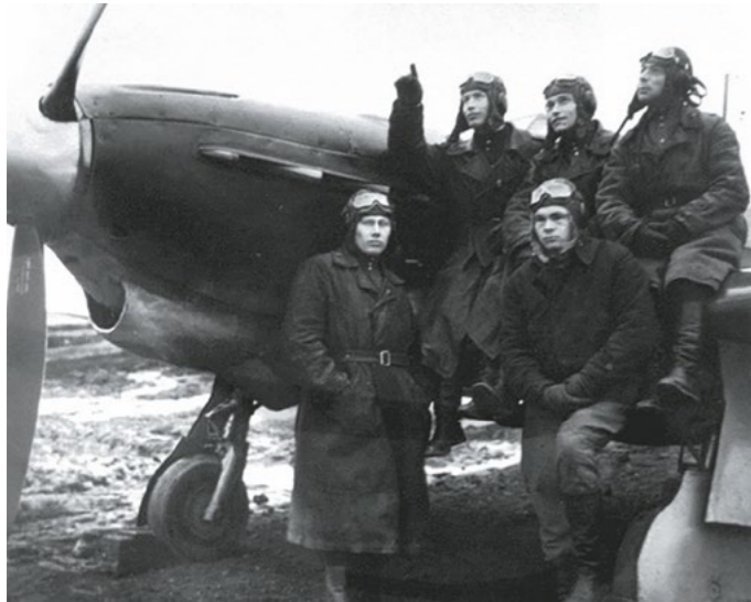
Летчики 14-го гвардейского истребительного авиаполка

224. Лошиц М. Ф. За рекой Ижорой // Заслон на реке Тосне: сб. воспоминаний ветеранов 55-й армии и жителей прифронтовой полосы (1941–44 гг.) / авт.-сост. И. А. Иванова и др. – Санкт-Петербург : Вести, 2012. – С. 397-401.