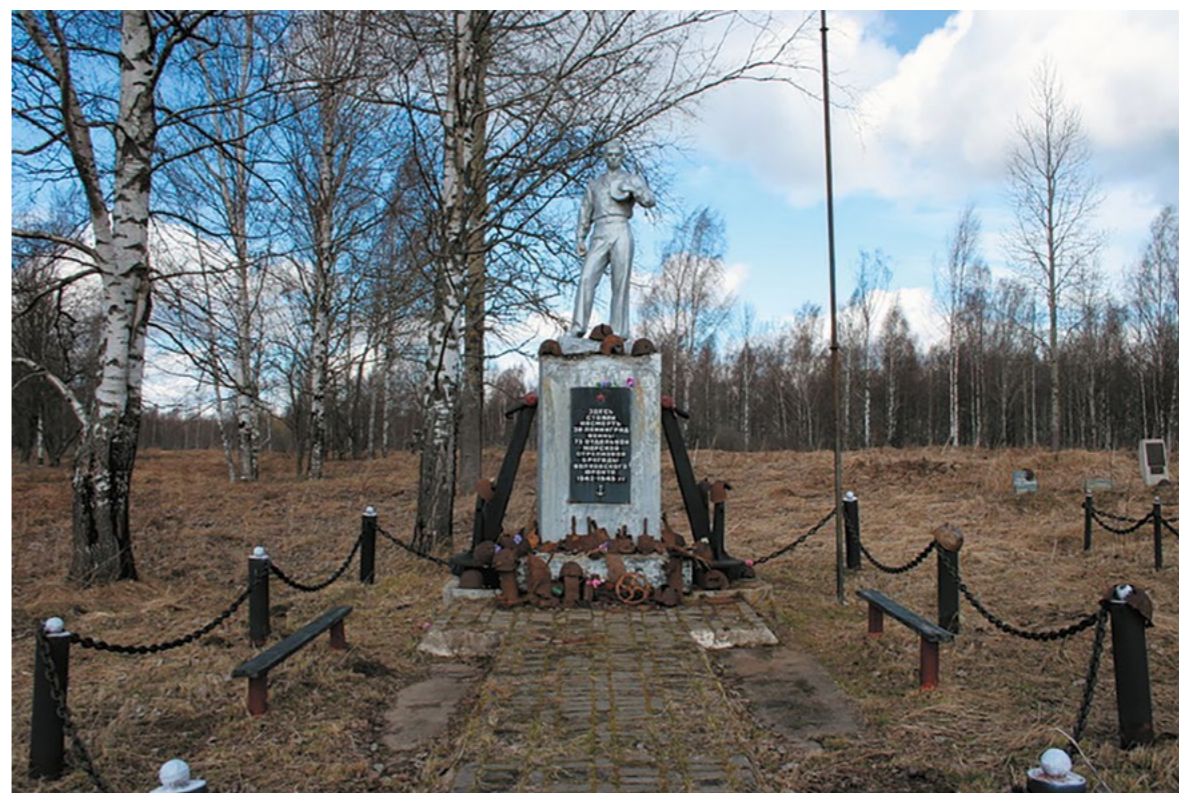
"Скорбящий матрос" – памятник морякам 73-й отдельной морской стрелковой бригады (расположен вблизи пос. Апраксин; Кировский р-н)

Воспоминания офицера немецкой 132-й пехотной дивизии о боях в районе дер. Гайтолово (не сущ., ныне тер. Кировского р-на) в феврале 1943 г. Действия отдельных немецких подразделений.