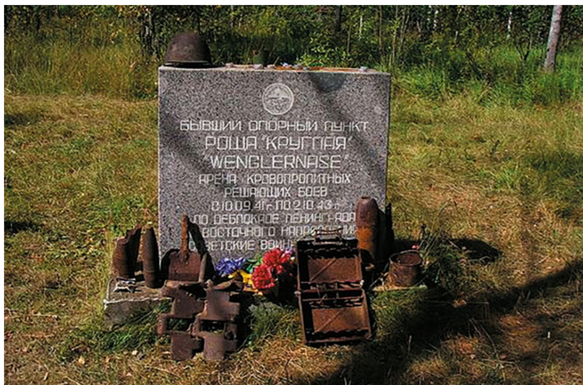
Памятный знак на территории рощи «Круглой» - месте боев советских войск с немецко-фашистскими захватчиками в 1941-1943 гг.