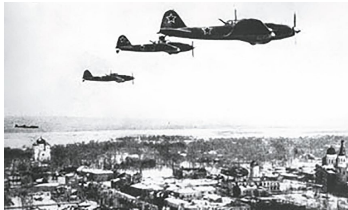
Советские истребители над Гатчиной. Январь 1944 г.

Действия партизанских отрядов в ходе операции «Январский гром». Силы партизан на территории Ленинградской области накануне операции. Схема расположения партизанских бригад и направления их действия в ходе операции.